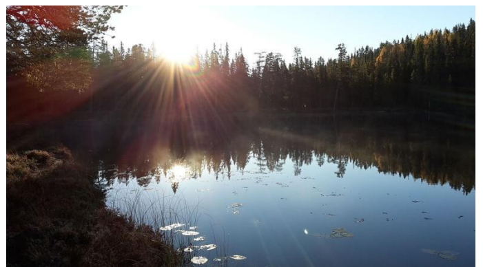
En ny morgon gryr

Vi har våra rutiner och planer för den närmaste framtiden. Men i det stora hela vet vi inte alls ens hur morgondagen kommer bli. Men det känns tryggt ändå att Jesus lova leda alla dem som tror på hans ord. Det får vi alla göra. Han kan bevara oss i både ingång och utgång i olika uppgifter i livet. Han tar vård om sina barn även om vi ibland måste ta farväl och våra väga skiljs åt. Det finns uppdrag i bönen som vi kan dela även om vi är miltals från varandra. Det finns ett uppdrag kvar att slutföra även om andra sviker eller lämnar oss. Dessutom får vi se framåt med spänning vad Gud har föreberett för alla dem som älskar honom. Men då är det ju viktigt att jag också har allting klart med honom. Att jag inte låter livet styras av omständigheter och sorger. Det är viktigt att jag lagt mitt liv i hans hand. Gud välsigne dig i din fortsatta tjänst för Herren!